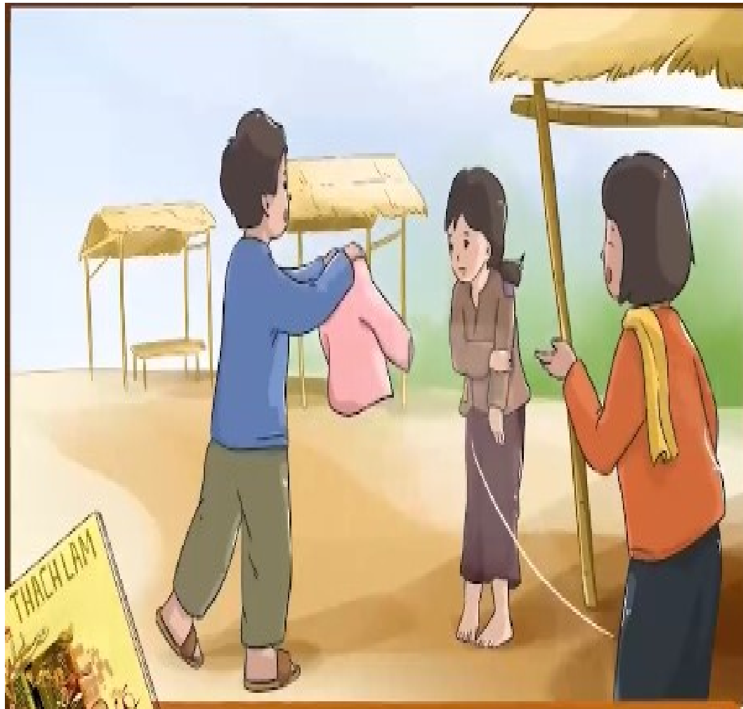
Truyện ngắn Gió lạnh đầu mùa

- Xuất xứ: “ Gió lạnh đầu mùa ” là truyện ngắn đặc sắc rút ra từ tập truyện cùng tên của Thạch Lam, xuất bản năm 1937.